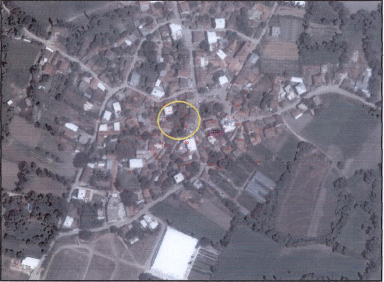
Resim 1: Uydu Görüntüsü

Plan değişikliği yapılan alan, Nilüfer İlçesi Ürnlü Mahallesi sınırları içerisinde yer almaktadır. 2015 yılı TÜİK verilerine göre Bursa İli Nilüfer İlçesi'nin toplam nüfusu 397.303 kişi olup, plan değişikliğinin yapıldığı Ürnlü Mahallesi'nin 2015 yılı nüfusu ise 1.495 kişidir.