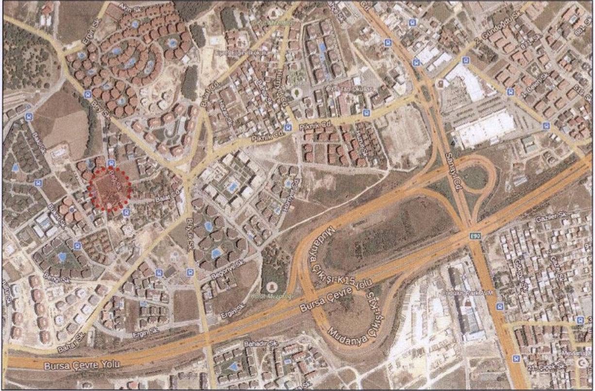
Plan Değişikliğine Konu Alanın Uydu Görüntüsü

Balat Mahallesi Bursa Merkezinin kuzeybatısında, Nilüfer Belediyesi sınırlarında bulunmaktadır. Plan değişikliği hazırlanan alan konumu itibarı ile Sanayi Caddesi (Mudanya Yolu Caddesi)' nin 1 km güneybatısında, Çevre Yolu'nun 350 m kuzeyinde yer almaktadır. Plan değişikliği hazırlanan alan 5030,09 m 2 büyüklüğündedir.