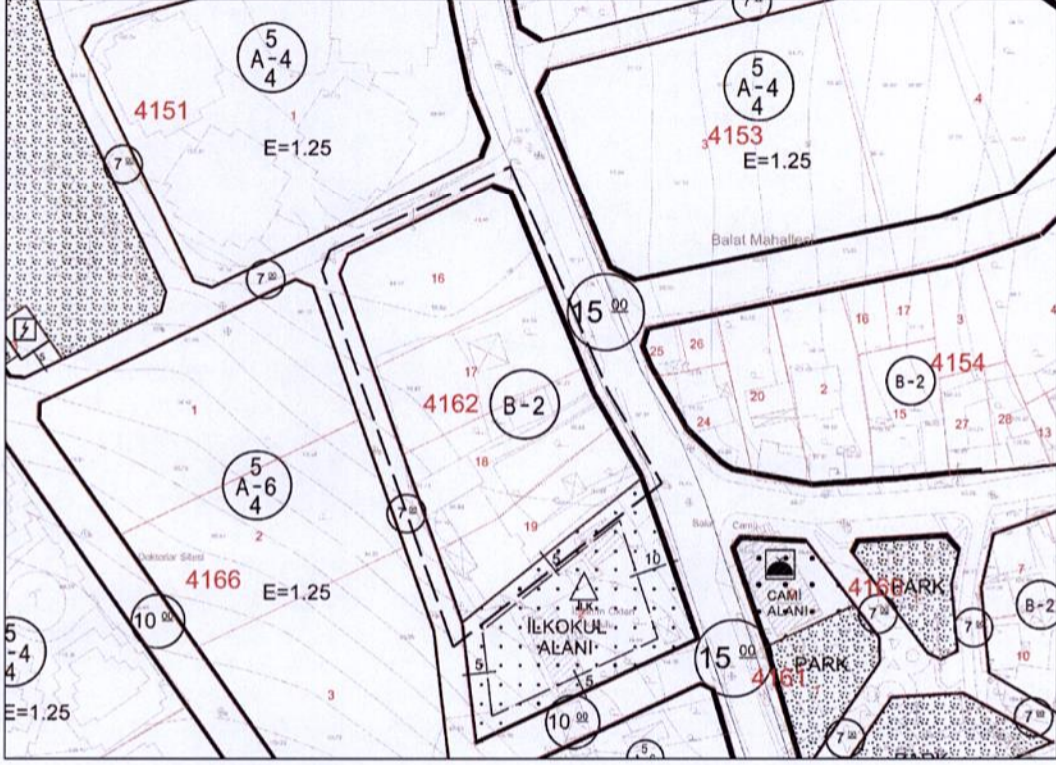
Onaylı 1/1000 Ölçekli Uygulama İmar Planı

Planlama alanı 1/1000 plan durumu: 1/1000 Ölçekli Balat Uygulama İmar Planı Revizyonunda 5030,09 m 2 büyüklüğündeki 4162 ada 16-17-18-19 parseller Bitişik Nizam 2 Katlı Konut Alanında kalmaktadır. Parseller doğudan 15 m genişliğindeki taşıt yoluna, batıdan ise 7 m genişliğinde yaya yoluna cepheli durumdadır.