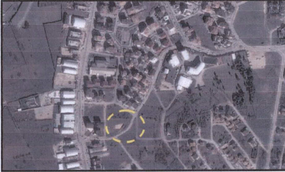
Resim 1: Uydu Görüntüsü

Plan değişikliği yapılan alan, Nilüfer İlçesi Demirci Mahallesi sınırları içerisinde yer almaktadır. 2016 yılı TÜİK verilerine göre, Bursa İli Nilüfer İlçesi'nin toplam nüfusu 415.818 kişi olup, plan değişikliğinin yapıldığı Demirci Mahallesi'nin 2016 yılı nüfusu ise 9.922 kişidir.