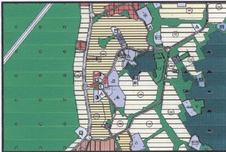
Resim 2. 1/5000 Ölçekli Nilüfer Nazım İmar Planı

Plan değişikliğine konu parsel, 1/5000 Ölçekli Nilüfer Nazım İmar Planı'nda 3484 Ada 4 parsel, Sağlık Tesisi Alanı'nda kalmaktadır.