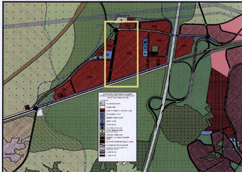
Onaylı 1/5000 Ölçekli Nazım İmar Planı Durumu