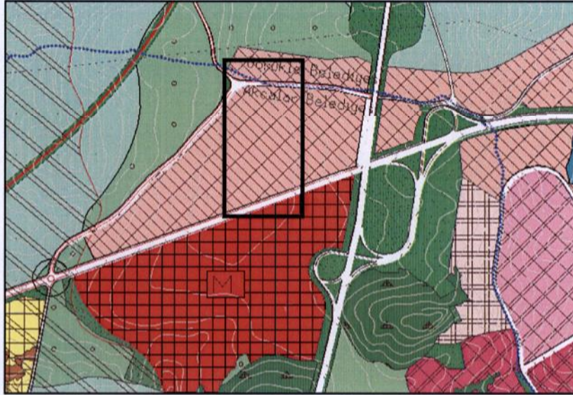
Onaylı 1/25000 Ölçekli Nazım İmar Planı Durumu