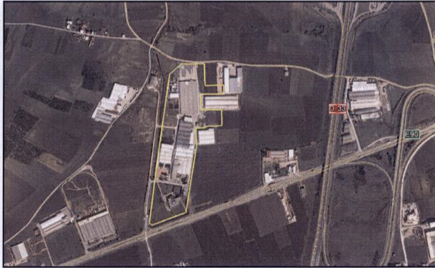
Plan Değişikliğine Konu Alanın Uydu Görüntüsü

Başköy Mahallesi Bursa Kent Merkezinin batısında, Nilüfer Belediyesi sınırlarında bulunmaktadır. Değişikliğe konu parsel konumu itibariyle, Bursa- Balıkesir karayolu- Çevre Yolu bağlantısının batısında yer alan Marmarabirlik Zeytin İşletmelerinin yer aldığı bölgedir. Parsel yüzölçümü 133.124, 33 m 2 büyüklüğündedir.