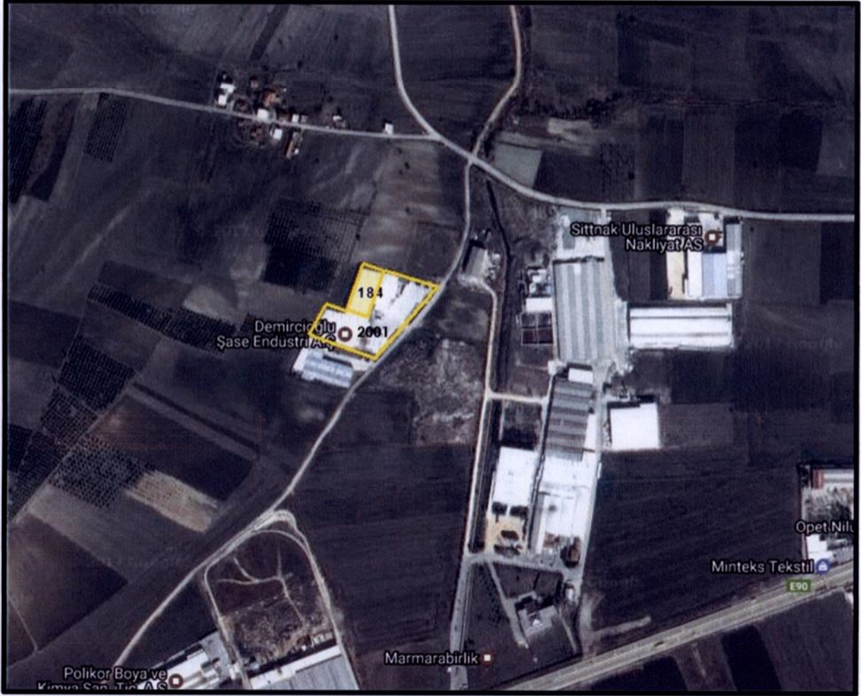
Şekil 1: Planlama Alanının Bölge İçerisindeki Konumu

Bursa İli, Nilüfer İlçesi, Başköy Mahallesinde bulunan yaklaşık 15775 m 2 büyüklüğünde olan planlama alanı yakın çevresinde Konut Dışı Kentsel Çalışma alanı bulunmaktadır.