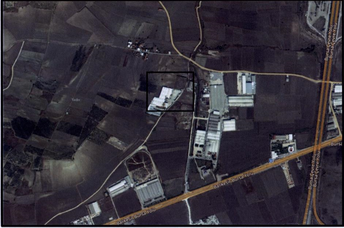
Şekil 2: Planlama Alanının Ulaşım İlişkileri