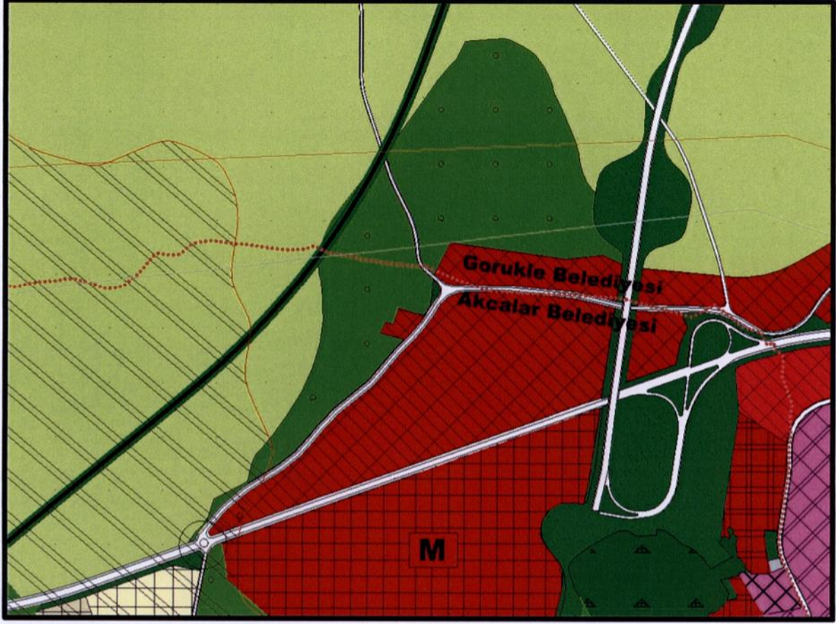
Şekil 3: Planlama Alanının 1/25.000 ölçekli Nazım İmar Planı İçindeki Yeri