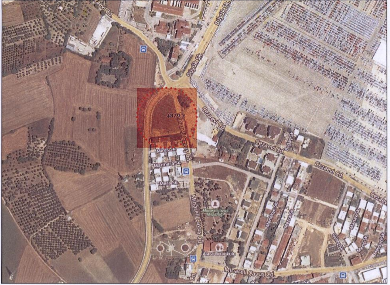
Plan Değişikliğine Konu Alanın Uydu Görüntüsü