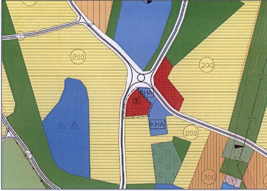
Onaylı 1/5000 Ölçekli Nazım İmar Planı Durumu