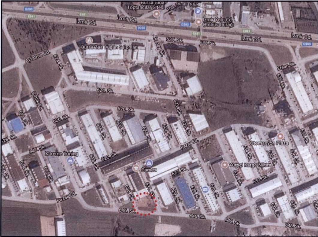
Plan Değişikliğine Konu Alanın Uydu Görüntüsü

Alaaddinbey Mahallesi Bursa Merkezinin batısında, Nilüfer Belediyesi sınırlarında bulunmaktadır. Plan değişikliğine konu alan konumu itibariyle, İzmir Caddesi'nin 425 m güneyinde, Beşevler Küçük Sanayi Bölgesi Alanında yer almaktadır. 2820 ada, 4 parsel 205,20 m 2 , 5 parsel 205,50 m 2 , 6 Parsel 205,50 m 2 , 7 parsel ise 205,50 m 2 büyüklüğündedir. Plan değişikliğine konu alan toplamda 821,70 m 2 dir.