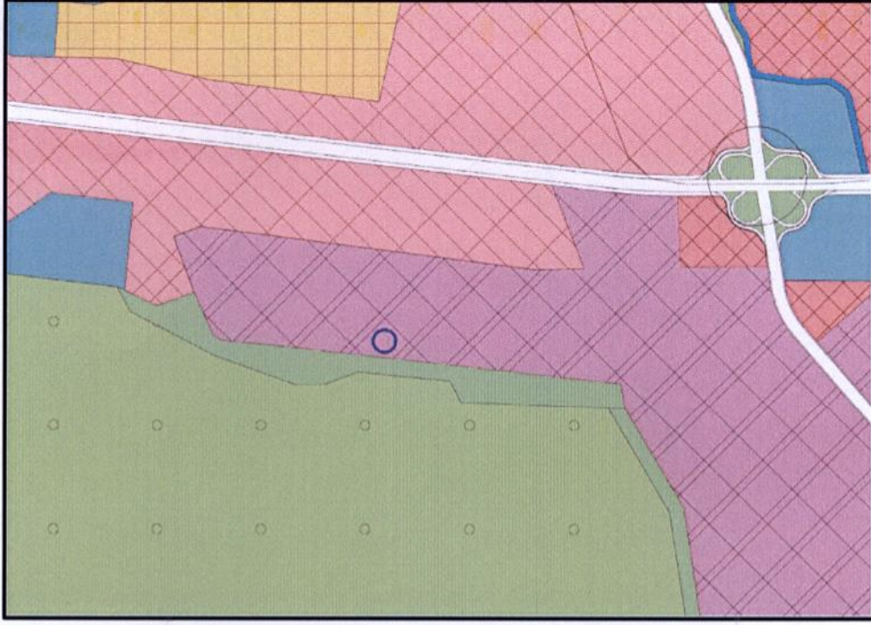
Onaylı 1/25000 Ölçekli Nazım İmar Plan