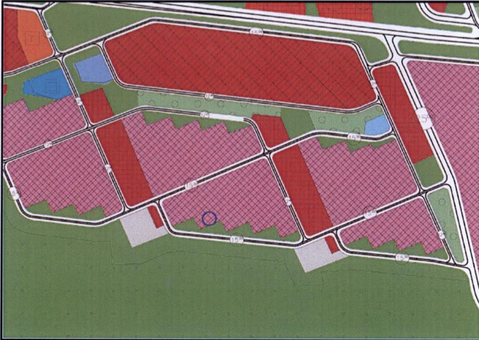
Onaylı 1/5000 Ölçekli Nazım İmar Planı Durumu