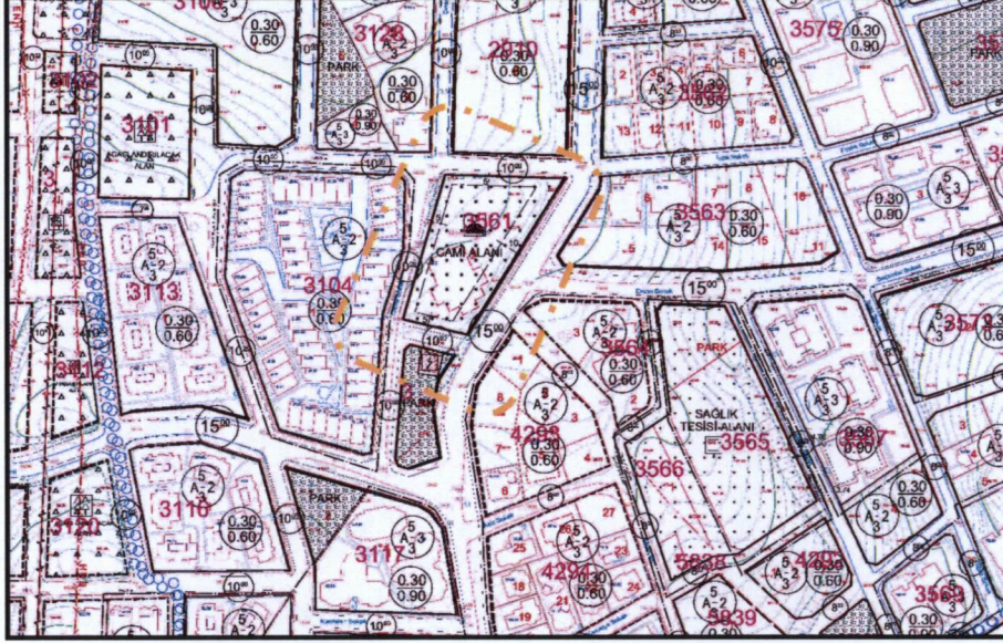
Resim 3. 1/1000 Ölçekli Uygulama İmar Planı

1/1000 Ölçekli Beşevler II.Etap Bölgesi Revizyonu Uygulama İmar Planı kapsamında, 3561 ada, 2 parsel Cami Alanı'nda, 3940 ada 14 parsel ise Park Alanı'nda kalmaktadır.