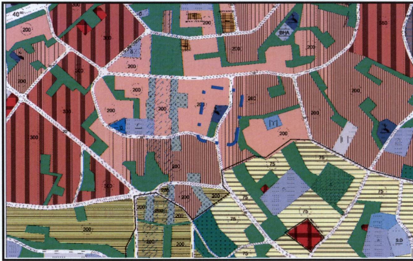
Resim 2. 1/5000 Ölçekli Nazım İmar Planı

1/5000 Ölçekli Nilüfer Nazım İmar Planı'nda plan değişikliğine konu alan, Cami Alanı ve Park Alanı'nda kalmaktadır.