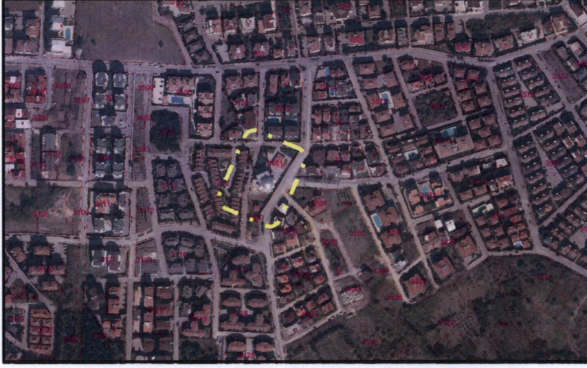
Resim 1. Uydu Görüntüsü

Plan değişikliği yapılan alan, Nilüfer İlçesi Kültür Mahallesi sınırları içerisinde yer almaktadır. 2018 yılı TÜİK verilerine göre Bursa İli Nilüfer İlçesi'nin toplam nüfusu 441.299 kişi olup, plan değişikliğinin yapıldığı Kültür Mahallesi'nin 2018 yılı nüfusu ise 11.943 kişidir.