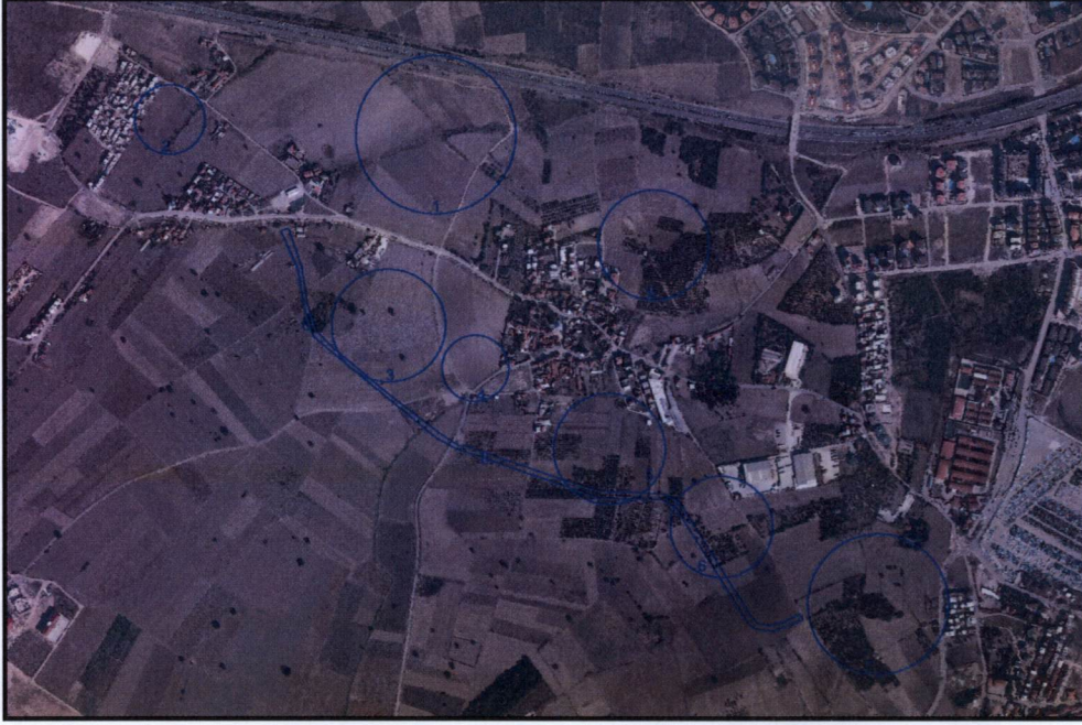
Resim 1: Uydu Görüntüsü

Plan deđişikliği yapılan alan, Nilüfer İlçesi Dođanköy Mahallesi sınırları içerisinde yer almaktadır. 2018 yılı TÜİK verilerine göre Bursa İli Nilüfer İlçesi'nin toplam nüfusu 441.299 kişi olup, plan deđişikliğinin yapıldığı Dođanköy Mahallesi'nin 2018 yılı nüfusu 2.062 kişidir.