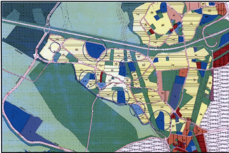
Resim 2. 1/5000 Ölçekli Nilüfer Nazım İmar Planı

6786, 6787, 6781, 6782, 6775 adalar ve muhtelif parseller 1/5000 ölçekli Nilüfer Nazım İmar Planı'nda ve 1/1000 ölçekli Doğan köy Uygulama İmar Planı'nda Park Alanı'nda yer almaktadır.(9)