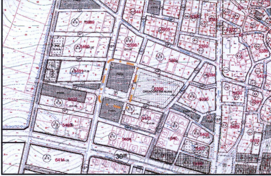
Resim 3. 1/1000 Ölçekli Uygulama İmar Planı

1/1000 Ölçekli Görükle Revizyonu Uygulama İmar Planı kapsamında, Park Alanı ve Otopark Alanı'nda kalmaktadır.