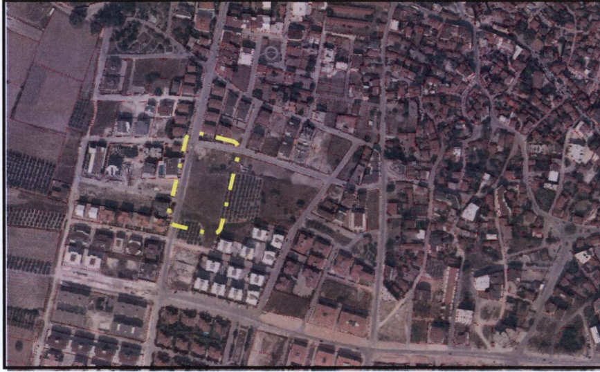
Resim 1. Uydu Görüntüsü

Plan değişikliği yapılan alan, Nilüfer İlçesi Dumlupınar Mahallesi sınırları içerisinde yer almaktadır. 2018 yılı TÜİK verilerine göre Bursa İli Nilüfer İlçesi'nin toplam nüfusu 441.299 kişi olup, plan değişikliğinin yapıldığı Dumlupınar Mahallesi'nin 2018 yılı nüfusu ise 20,247 kişidir.