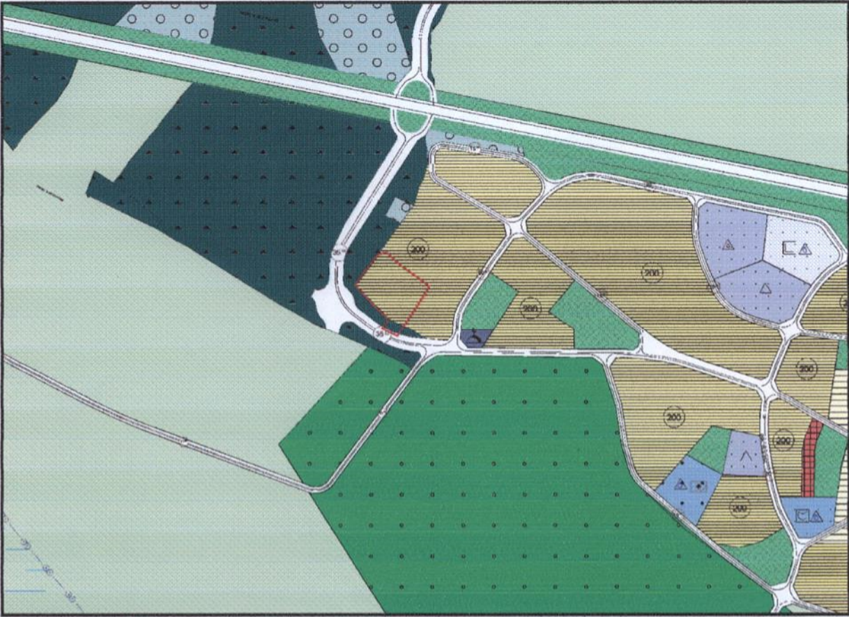
Resim 2. Nazım Plan