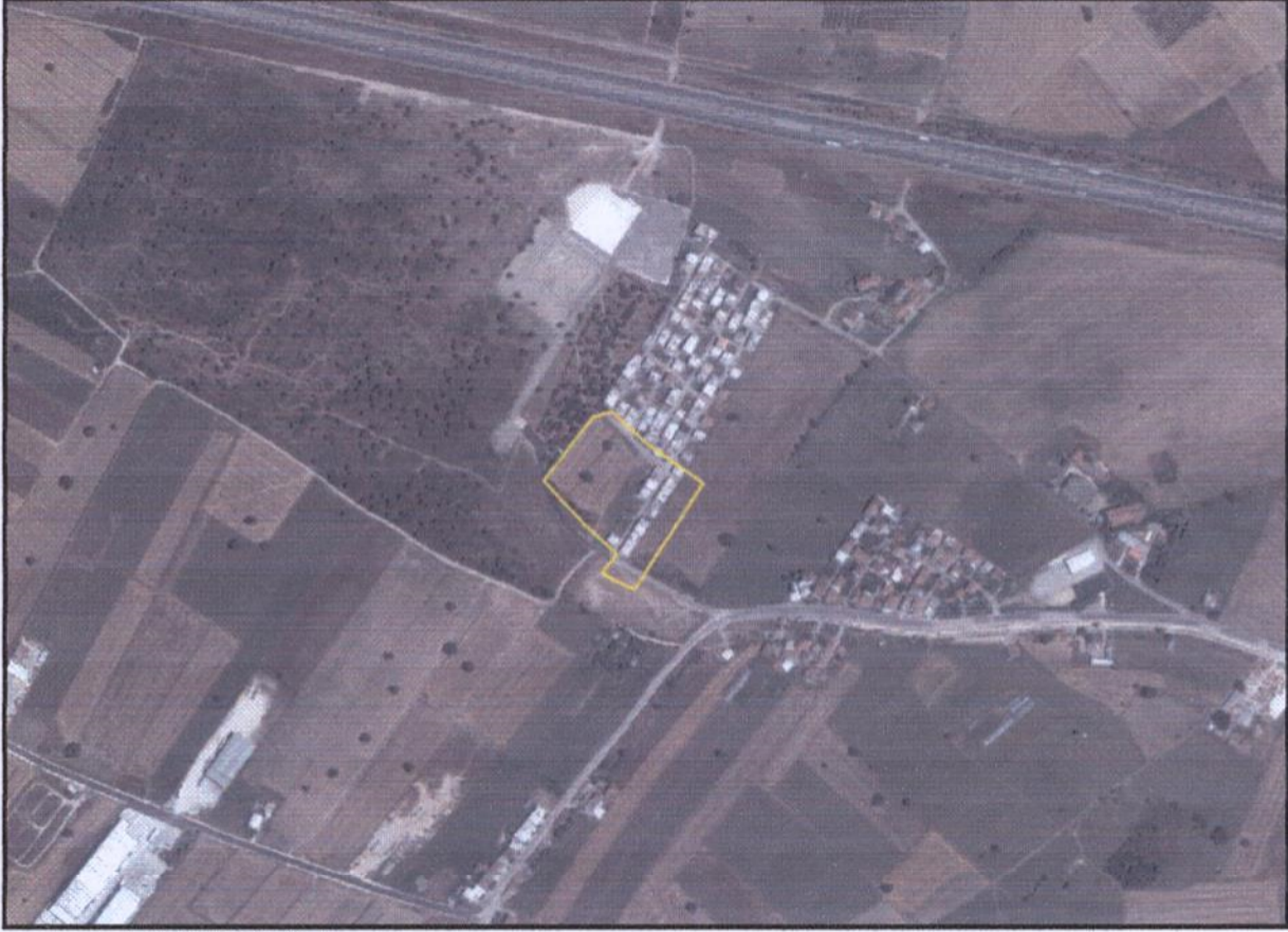
Resim 1. Uydu Görüntüsü

Plan değişikliği yapılan alan, Nilüfer İlçesi Doğanköy Mahallesi sınırları içerisinde yer almaktadır. 2015 yılı TÜİK verilerine göre Bursa İli Nilüfer İlçesi'nin toplam nüfusu 397.303 kişi olup, plan değişikliğinin yapıldığı Doğanköy Mahallesi'nin 2015 yılı nüfusu ise 1955 kişidir.