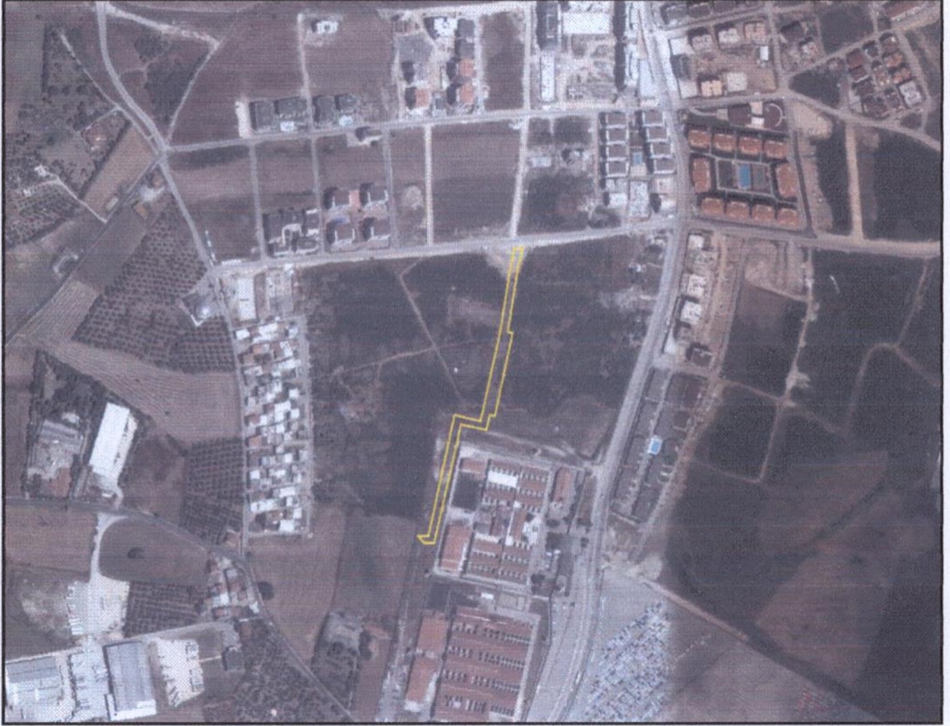
Resim 1. Uydu Görüntüsü

Plan değişikliği yapılan alan, Nilüfer İlçesi Balat Mahallesi sınırları içerisinde yer almaktadır. 2015 yılı TÜİK verilerine göre Bursa İli Nilüfer İlçesi'nin toplam nüfusu 397.303 kişi olup, plan değişikliğinin yapıldığı Balat Mahallesi'nin 2015 yılı nüfusu ise 8444 kişidir.