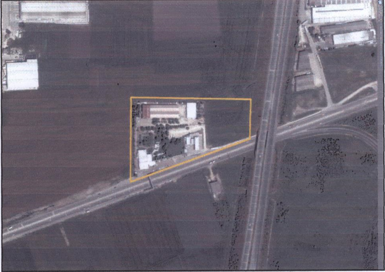
Resim 1. Uydu Görüntüsü

Plan değişikliği yapılan alan, Nilüfer İlçesi Başköy Mahallesi sınırları içerisinde yer almaktadır. 2015 yılı TÜİK verilerine göre Bursa İli Nilüfer İlçesi'nin toplam nüfusu 397.303 kişi olup, plan değişikliğinin yapıldığı Başköy Mahallesi'nin 2015 yılı nüfusu ise 264 kişidir.