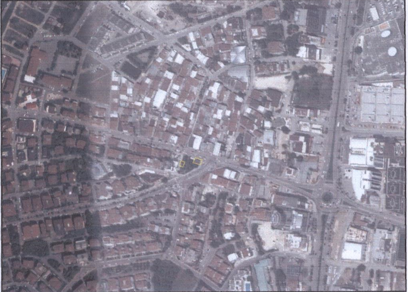
Resim 1. Uydu Görüntüsü

Plan değişikliği yapılan alan, Nilüfer İlçesi Konak Mahallesi sınırları içerisinde yer almaktadır. 2015 yılı TÜİK verilerine göre Bursa İli Nilüfer İlçesi'nin toplam nüfusu 397.303 kişi olup, plan değişikliğinin yapıldığı Konak Mahallesi'nin 2015 yılı nüfusu ise 23.414 kişidir.