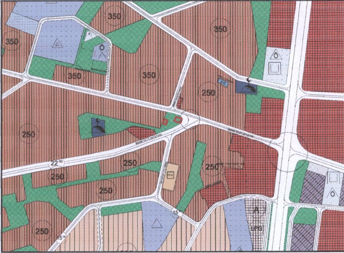
Resim 2. Nazım Plan