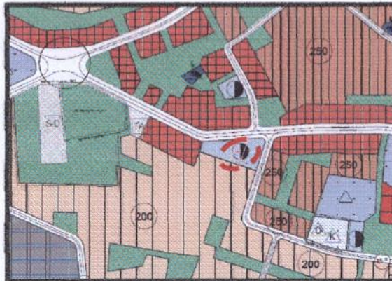
Resim 2. 1/5000 Ölçekli Nilüfer Nazım İmar Planı

Plan değişikliğine konu alan, 1/1000 Ölçekli Nilüfer Nazım İmar Planı'nda 1/5000 ölçekli Nilüfer Nazım İmar Planı'nda Yönetim Merkezi Alanı'nda kalmaktadır.