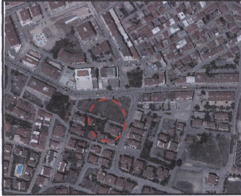
Resim 1: Uydu Görüntüsü

Plan değişikliği yapılan alan, Nilüfer İlçesi Beşevler Mahallesi sınırları içerisinde yer almaktadır. 2015 yılı TÜİK verilerine göre Bursa İli Nilüfer İlçesi'nin toplam nüfusu 397.303 kişi olup, plan değişikliğinin yapıldığı Beşevler Mahallesi'nin 2015 yılı nüfusu ise 21.221 kişidir.